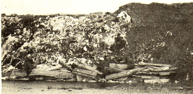
Skládka v Stupave

môžete pozrieť ako to v súčasnosti na tejto skládke vyzerá.