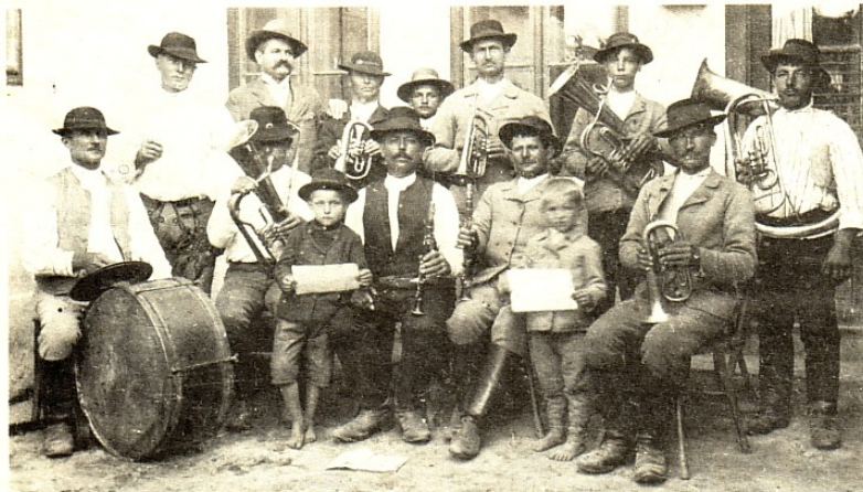
Dychovka z roku 1910